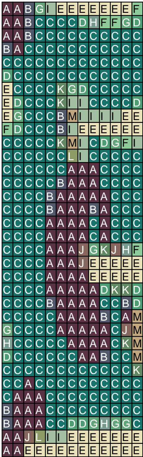
Chart #:H Chart #:I Chart #:J Chart #:K Chart #:L Chart #:M DB-2127 DB-1415 DB-2271 DB-1575 DB-2357 DB-772 Count:8 Count:22 Count:7 Count:16 Count:5 Count:11

Chart #:A Chart #:B Chart #:C Chart #:D Chart #:E Chart #:F Chart #:G DB-1574 DB-2143 DB-458 DB-788 DB-1272 DB-1844 DB-1171 Count:161 Count:30 Count:470 Count:25 Count:86 Count:13 Count:17